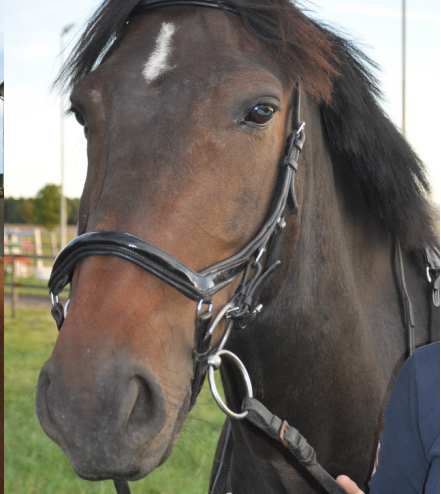
Foto: Fr. v. Kottesse, Prinsen, Plupp, Loftus, Sparky och Black Mick. Foto: Privat, Emma Tegler m.fl.