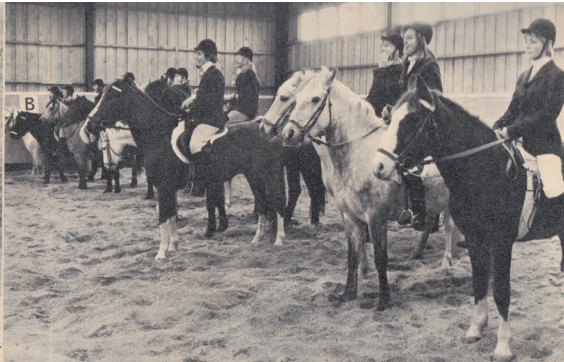
Ungdomarna uppställda till parad i sitt eleganta ridhus.

och hade en hejdundrande uppvisning för uppskattningens 700 föräldrar.