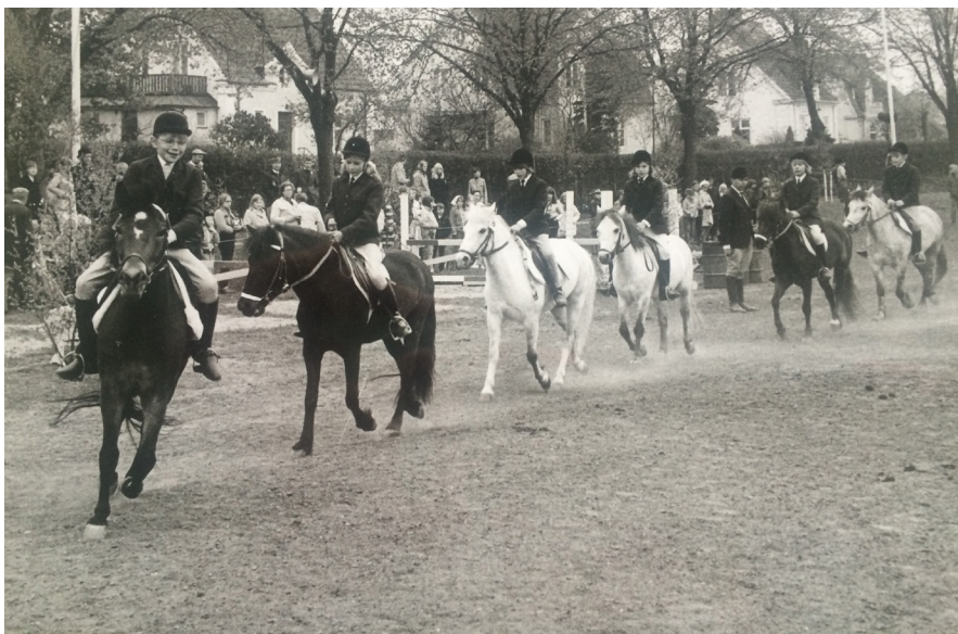
Foto: Kadrijlj på Södra lekplatsen 1970

Klubbens största inkomstkällor är ridskolan och bidrag från stat och kommun för de sammankomster, som vår ungdomsverksamhet berättigar till. 1995 svarade dessa inkomster för ca 75 procent av intäkterna. Idag är siffran lägre än 50%. För resterande intäkter är vi hänvisade till tävlingsarrangemang, sponsorer, stiftelser, fonder m m. Det är självklart att frånvaron av utgifter genom medlemmars och andras frivilliga arbetsinsatser är av avgörande betydelse för ekonomin.